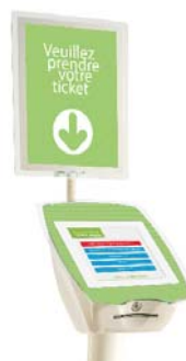
• Kit signalétique simple ou rétro-éclairé