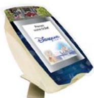
• Support bureau