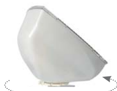
• Système rotatif