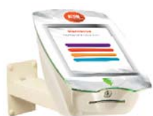
• Support mural