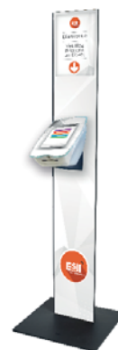
• Totem Twana™